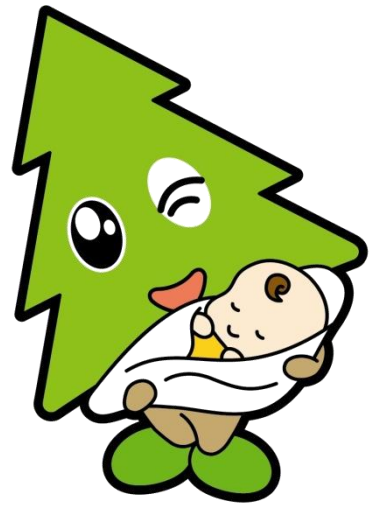
秋田県マスコット スギッチ