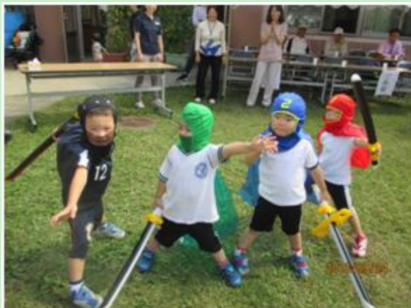
レンジャー参上！！かっこいいでしょ！

選手宣誓！がんばります！ 元気な子どもの声で始まった運動会。今年はカオナシが登場しました。怖くて泣き出しちゃう子どもたち。そこに現れたのは勇敢なちびっこレンジャー！パンチやキックでカオナシを無事退治しました。 (森川)