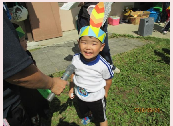
ダンス 上手に踊れたよ〜♪

運動会当日、ちょっぴり恥ずかしがる時もあったけど、最後まで元気いっぱい頑張ったK君。フィナーレダンスは何度も何度も練習しました。踊り終えた時のこの表情！「運動会たのしかった〜！」と達成感を感じたようです。 (畠山)