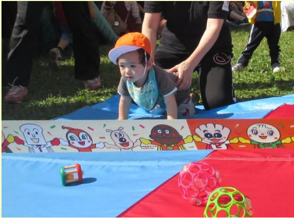
おもちゃめざしてよーいドン！

おひさまキラキラいい天気。 おひさまの元気な力をかりて、赤ちゃんチームはハイハイ、かけっこ頑張りました！ 競技でゲットしたおやつは、格別に美味しい！ パクパク、ムシャムシャ完食です。 (高橋)