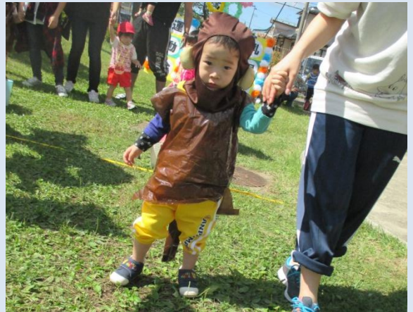
おさるさんに変身したよっ！

普段は元気いっぱい！かけっこ大好きな子どもたち。「よーいどん」の合図で走り出すと思いきや…ドキドキ緊張。不安な表情でのゴールでしたが、おやつタイムにはいつものニコニコ笑顔の子たちでした。来年は一等賞めざして頑張るぞ〜！ (松淵)