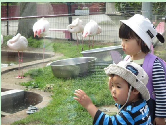
フラミンゴの美しさにうっとり

院外保育で大森山動物園へ。生で見る動物たちの迫力に大興奮の子どもたち。ペンギンさんのプールを上からのぞいて、クルクルと手を回してみたSくん。するとペンギンさんもクルクル回って大サーブス！ペンギンさんからの嬉しいサプライズもありました。（木元）