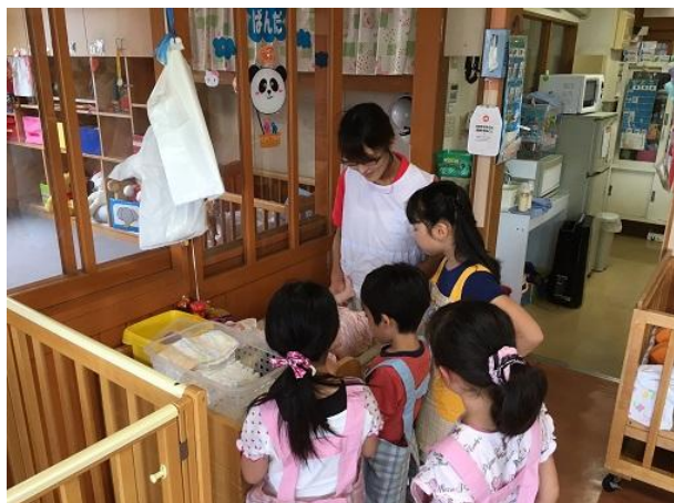
おむつを替えて気持ちいいね

実際に赤ちゃんに触れ合うことで赤ちゃんの可愛さを感じ、乳児院のお仕事を身近に感じてくれた様子でした。 将来の保育士に一步前進♪