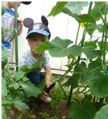
このきゅうり ぼーくの！

乳児院では、春になると小さな畑で、子どもたちと一緒に野菜作りをしています。苗を植え、水やりをし、大きく育った野菜を収穫します。収穫した野菜が夕食に出ると「これ、僕が取ったきゅうり？」と聞きながら、普段は野菜が苦手な子もおいしい！おいしい！と連呼し、パクパク食べています。