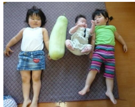
赤ちゃん大きさが一緒！！

青いトマトを指差し「これ取っていい？」と聞く子どもたち。夕顔の大きさにビックリな子どもたち。これから秋にかけ次々収穫時期を迎える野菜たち。次は何を収穫できるのかな？ 乞うご期待！