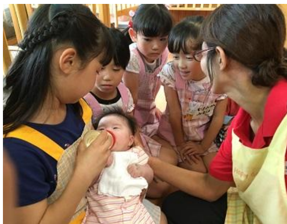
赤ちゃんの肌、ぷにぷに柔らかいよ～

参加してくれた子どもたちは、エプロンをして小さな保育士に変身！赤ちゃんにミルクを飲ませたり、ご飯を食べさせてもらいました。赤ちゃん重かった、ミルクを沢山飲んで嬉しかった！などの感想を聞くことができました。