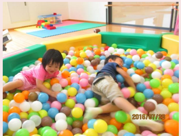
ボールプール 気持ちいい♪

待ちに待ったバスでのお出かけ。早速、緑色のバスに乗り込むと「あれ？声がする」「(文字板)光ってる」と目をキラキラさせている子どもたち。アルヴェではお気に入りのボールプールやトランポリン、トンネルなどで、くり返し何度も楽しみました。（高橋）