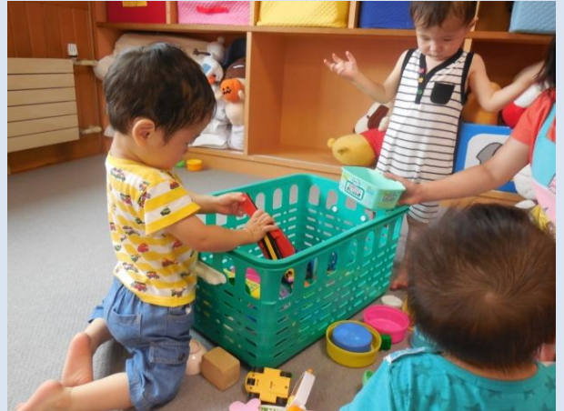
ご飯の前にはお片づけだよね(^_^)

今年度は、5人の子どもたちでスタートし、早くも4か月が過ぎました。「お片づけだよ～」、「ごはんだよ～」の声にすかさず行動！片づけや自らイスに座る姿が見られます。一日一日成長し感動の毎日です。（鈴木い）