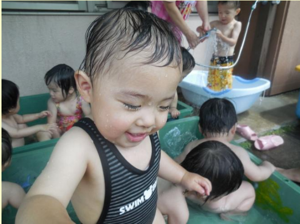
やっぱり暑い日は水遊びだぜ！

夏本番！の今日この頃。職員の「今日、ちゃぶちゃぶしようか！」の声が聞こえると、みんな外に向かって猛ダッシュ。ひよこ組のちっちゃい子どもたちも水遊びが大好き！夏の暑さを吹き飛ばすかの如く水をちゃぶちゃぶしています。（小玉）