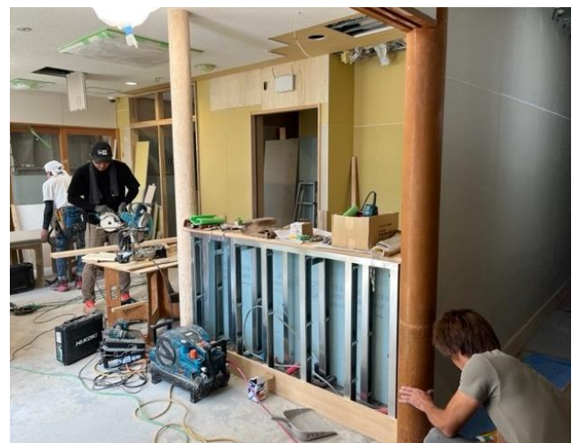
現在のばんび組の様子です。 (お風呂やトイレ、システムキッチン等を整備中)

みんな思い思いに玩具にふれ、楽しんでいました。 地元の小学生のお兄さん、お姉さんともふれあうこと ができ、素敵な夏の思い出となりました！