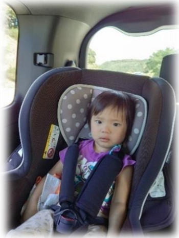
大きな車に乗ってのお出かけに ちょっぴり緊張…