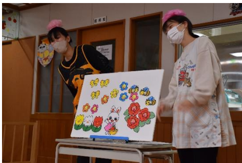
パネルシアターの様子

昼食は、ホールにビニールシートを敷いて、お弁当を食べました。青空の下で…という訳にはいきませんが、それでもみんなでお弁当を食べるお弁当は格別！たくさんの笑顔を見ることができた一日でした。