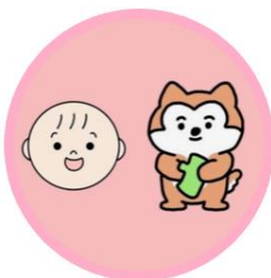
↑ プロフィール画像

昨今におけるSNSの活発化、情報発信手段としての有用性を加味し、今年度より当院でも公式Twitterを開設する運びとなりました。今後は、子どもたちの日常や行事の様子、愛あいクラブやプレママサロン等の情報発信、採用情報など、乳児院に関する情報を随時投稿していく予定です。ぜひフォローをお願いします♪