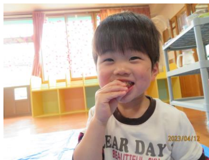
お弁当おいしいね(〜♪)