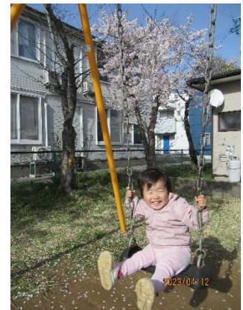
後日改めて近所の公園までお花見へ。 とってもいい笑顔☆