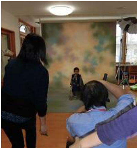
プレイルームがスタジオに変身！撮影開始