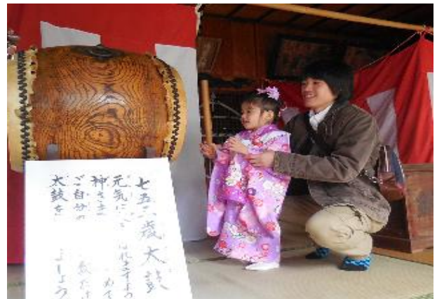
元気に大きくな～れ