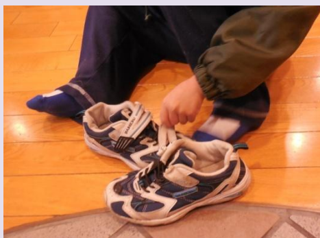
マジックテープをはがす