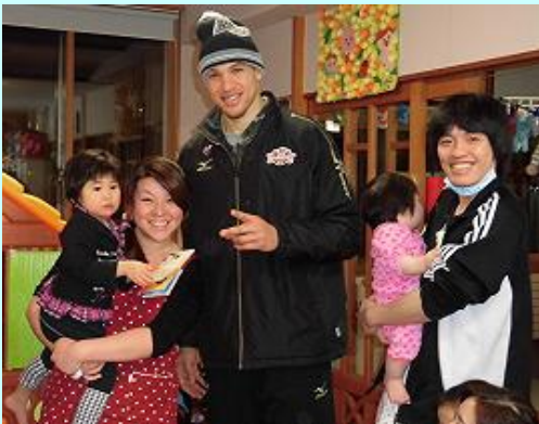
子どもたちより、職員の方が喜んでる (*^_^*)

1月22日、秋田ノーザンハピネッツのリチャード・ロビー選手が来院され衣類のご寄付をしてくださいました。初めて見る背の高いロビー選手を見て、子どもたちは、びっくりして泣き出してしまった子もいました。