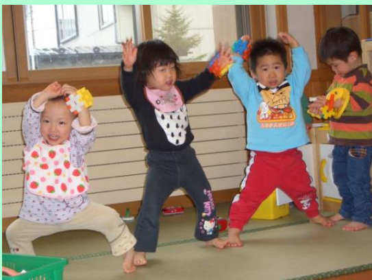
腕輪をつけたら、ゴーカイジャーに変身！

最近、クラスではオモチャの取り合いで「貸して」「嫌！」の繰り返し。言われた子はしょんぼり…。でも時には「いいよ」と譲ってくれる子も。貸してあげた子は「貸した！貸した！」と満足気。たくさん芽生えを伸ばして行ってあげたいです♪ (今)