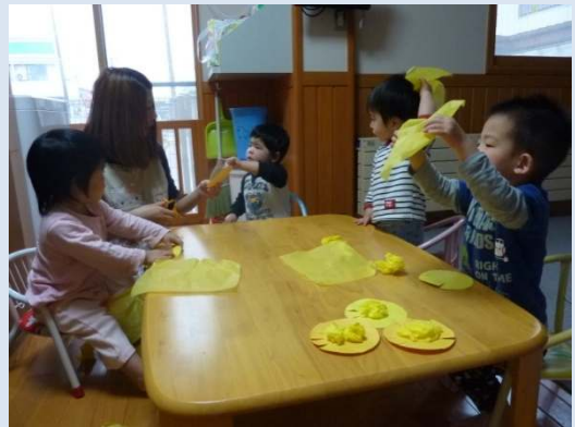
「ほら、こうするんだよ！」

リーダーシップを発揮しているのは、ぼんだ組2年目のRくん。遊びや食事時には、新しいお友だちのお世話をしてお兄さん気取りです。でも、みんなはお構いなしのあっちこっちにバラバラです。近いうちに落ち着いた子どもたちをお目に掛けますね。(伊藤)