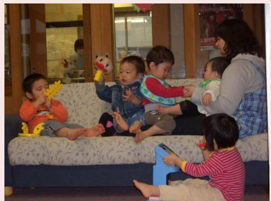
ソファでゆったり