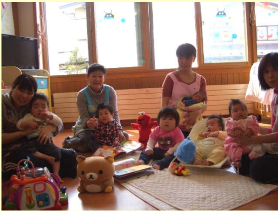
いっぱい飲んで、食べて大きくなるぞ～

最近声を上げて笑うようになった赤ちゃんと、小さい子の頭をなでなでしてくれるやさしいお兄さんお姉さんの6人のメンバーです。たくさんお外で遊んでたくましくなります。(石川)