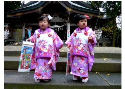
七五三参り。神社でパチリ☆