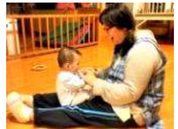
ぎっこんぱったん