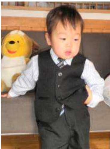
さすがイケメン、ポーズが決まってるね。