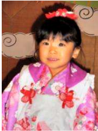
おすまして、パチリ！