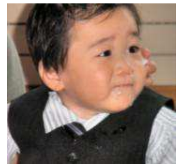
癒し系？ジャニーズ系？