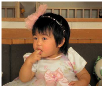
王子さま、早く迎えにきて～！