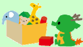
(出来上がった龍は表紙の写真です)