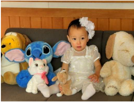
わたし、いぶちゃん。うふふ♪