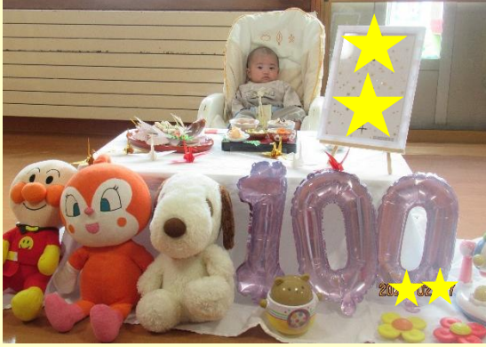
これからもすくすく大きくなってね♪

2026年が始まり早くも3か月。ひよこ組は寒さに負けず、元気いっぱい、にぎやかに過ごしています。先日は11月生まれのお友だちのお食い初めがありました。「一生食べることに困らず元気に大きくなりますように」と健やかな成長を願ってみんなでお祝いしました。(木元)