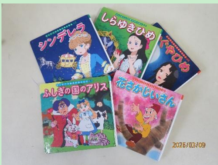
ど・れ・にしようかな～？