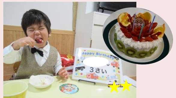
大好きなイチゴを丸々頬張れる幸せ♡