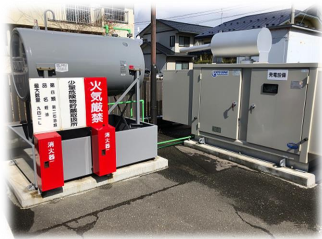
(2日間は備蓄燃料で施設へ電源を供給！！)